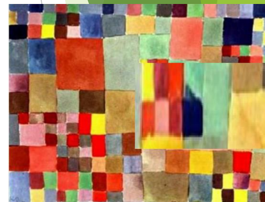
Paul Klee, 1927